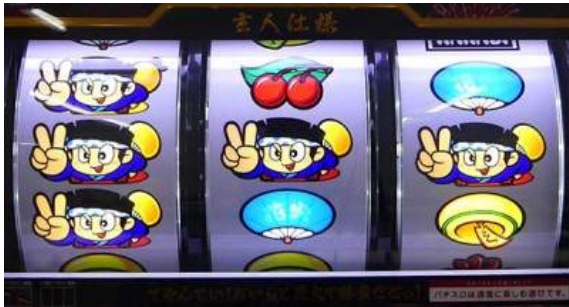
紅七連線與 DON 連線的 BONUS