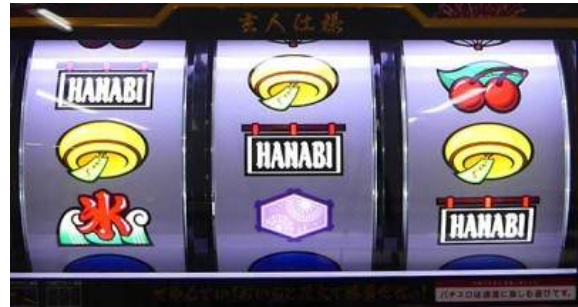
BAR 連線或 7.7.BAR 連線的 BONUS