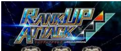
RANK UP ATTACK