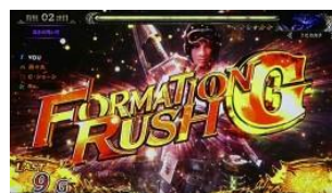
FORMATION RUSH G