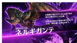
設定 6 濃厚