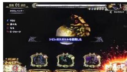
シビレガスガエル

翻倒、麻痺等一部分的狀態異常發動時會封住魔物的行動，此時無論成立小役一定攻擊確定 如果狀態異常持續就能連續攻擊，此時 FR 的轉數也會停止減少。基本上給予傷害時才會累積後發動 只有シビレガスガエル會在 FR 中成立特殊小役或是銅鐘時抽選發動