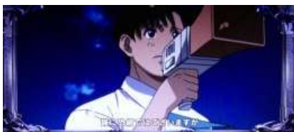
讓液貨船成功停泊