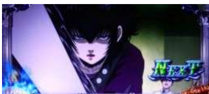
將ソーヤー給擊退