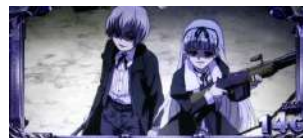
VS ヘンゼル&グレーテル