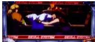
イエローフラッグ