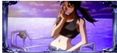
ラグーン号ドック