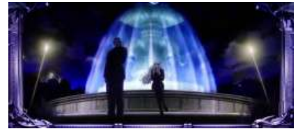
バラライカ ステージ

通常時的場景有四種，會依照滯在場景示唆高確期待度，基本場景為ロアナプラ市街地與ラグーン商会事務所，ラグーン号ドック移行時為高確滯在好機，バラライカステージ為高確濃厚