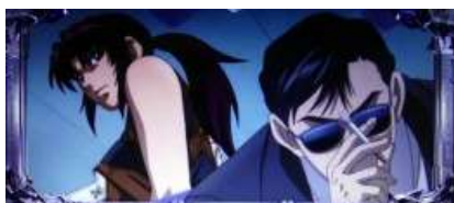
將武裝集團給擊退