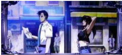
ロアナプラ市街地