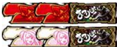
神輿挑戰/神社祭典 BONUS