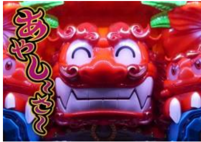
有點可疑樂獅演出

BONUS 成立時當轉或是下一轉必定發生告知，基本告知方式為小樂獅開口+警示燈閃爍 其他的告知出現時為 BIG 濃厚