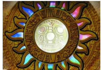
黃金印地 (對應 BONUS)