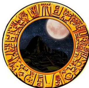
夜晚+滿月 (設定 4 以上!?)