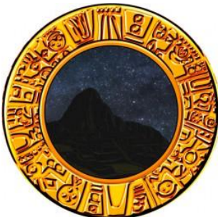
夜晚 (設定 2 以上!?)