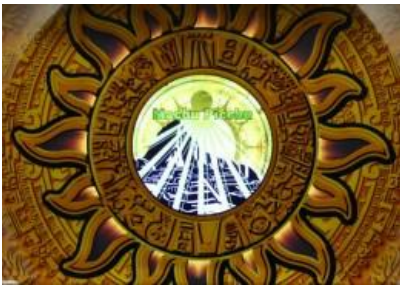
馬丘比丘 (對應西瓜)