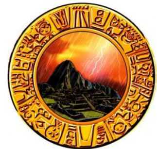
黃昏+雷雨 (偶數期待高)