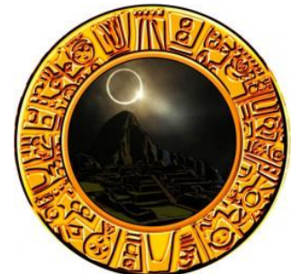
日環食 (設定 6 確定!?)