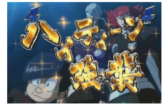
VS ハイティーンナンバー

009 或惡魔人單獨與敵人戰鬥的立直，標題、台詞、照明顏色是紅色為好機，是金色為大好機 演出中另外一邊的英雄參戰時則往共闘 SP 立直發展