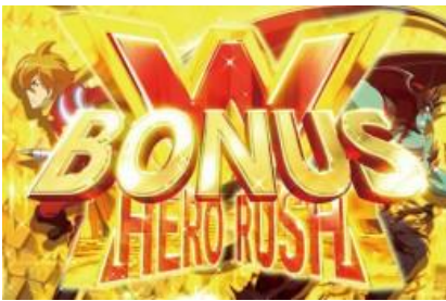
W-HERO RUSH BONUS