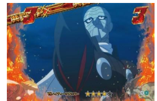
VS ハイティーンナンバー