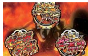
錢形 BIG 中的連續演出成功時發生