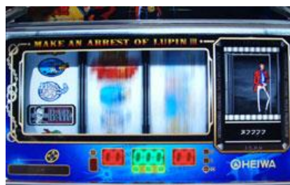
錢形 BIG 結束後的魯邦搜索中畫面突入，發生時為 3G 連的好機

3G 內將魯邦逮捕的話則再突入錢形 BIG 確定!，如果出現前一代的畫面的話為確定!?