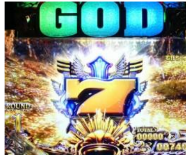
GOD GAME BONUS