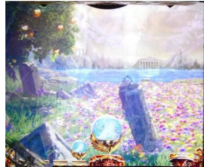
ヘスペリデスの花園

通常場景有好幾種，滯在 HERCULES 模式與 ZEUS 模式時有可能為潛伏確變，棄台時請注意