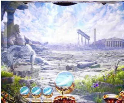
カドメイアの遺跡