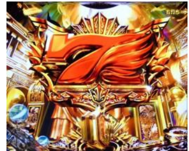
SPECIAL GOD GAME BONUS

大當只有 4R 與 16R 兩種 起動口的 16R 與電嘴的 4R 大當時則為到次回大當的電嘴補助且確變濃厚