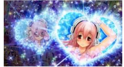
索尼子 STEP UP 演出

持續到 STEP5 則為開獎濃厚 如果出現 PUSH、觸摸演出 或者是紅色則期待度上升