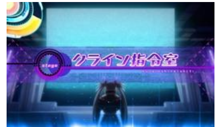
クライン指令室場景

通常時場景除了上面三種還有一個遊樂場場景，祭典會場可期待 CZ 高確或前兆 指令室場景可期待 CZ 前兆。還有指令室場景的特效顏色會示唆 CZ 的當選期待度