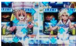
跳舞對決，目標高得分