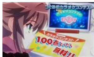
卡拉 OK 歌唱比賽