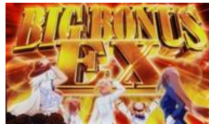
BIG BONUS EX

異色七為 BIG，紅七連線為 BIG EX 為純增 200 枚的純正 BONUS，消化中紅 7 連線則當選 ART，EX 中的紅七連線確率 比一般的 BIG 多十倍！