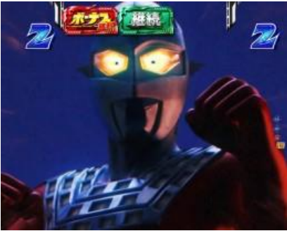
VS KING JOE 以外