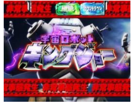
KING JOE BATTLE

無敵激闘模式中對決 KING JOE 以外的怪獸時則不會敗北，所以期待能夠對決其他的怪獸發生必殺技 ATTACK 時則為勝利的大好機。如果 KING JOE 襲來時則為危機，能夠阻止合體的話則 RUSH 繼續，阻止失敗的話則會發展對決，希望對決中不要被打倒！