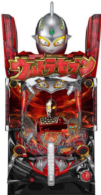
千珠平均該到達回轉數