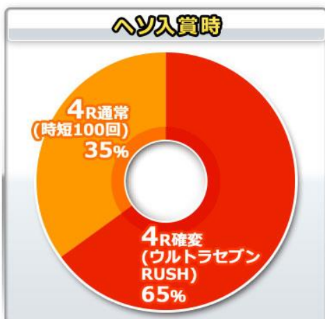
大當 ROUND 數分配比例-起動口入賞時