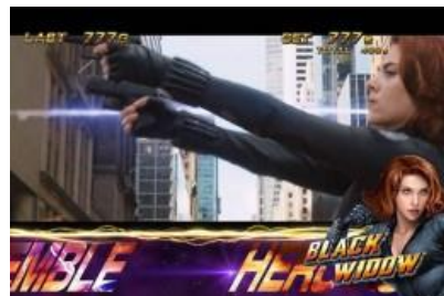
アッセンブル場景

ART 中會依照滯在場景示唆內部狀態，S.H.I.E.L.D.場景為上乘高確率？ アベンジャーズ場景為上乘超高確率，アッセンブル場景為アベンジャーズ場景的前兆場景