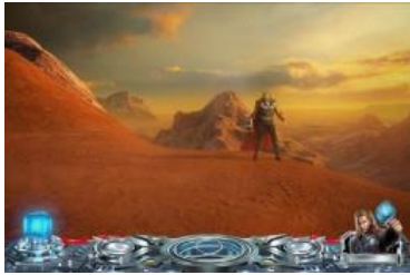
マイティ・ソース場景