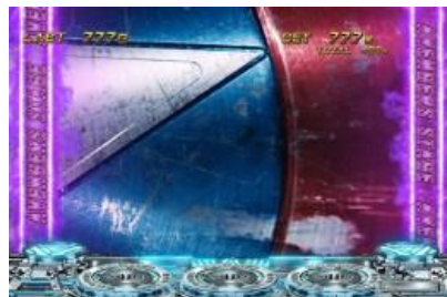
アベンジャーズ場景