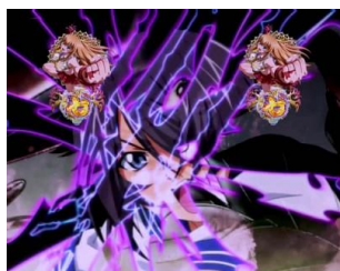
關羽 VS 三柱神