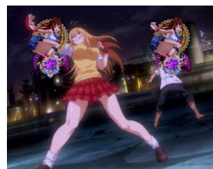
孫策 VS 曹操

對決演出有上面的四種，孫策 VS 曹操為好機。哪個只要停止決戰無雙圖案則往後半小液晶畫面上升後發生軍師格言或是覺醒鬪士則期待度上升，特別是覺醒鬪士