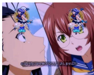
劉備 VS 夏侯淵