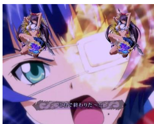
呂蒙 VS 許褚