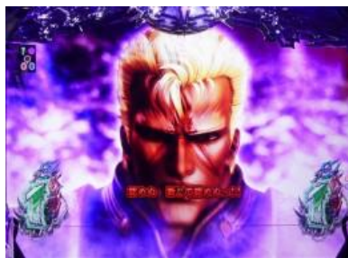
南斗聖拳 VS 北斗琉拳