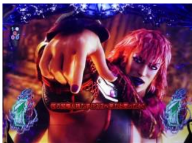
北斗神拳 VS 背叛的南斗聖拳