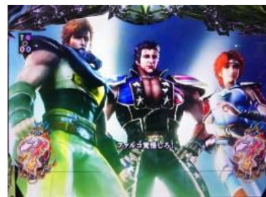
北斗軍 VS 元斗皇拳