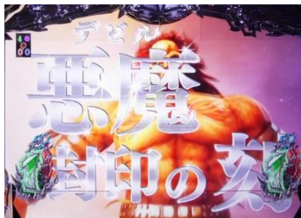
南斗最後的將立直

繼承前作的四兄弟立直、本機五大演出之一的南斗最後的將立直，只要發展時都很有期待度