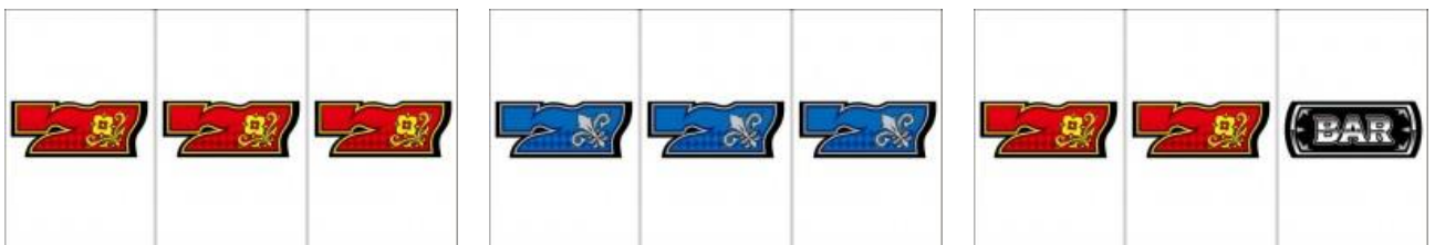
紅 7 BIG