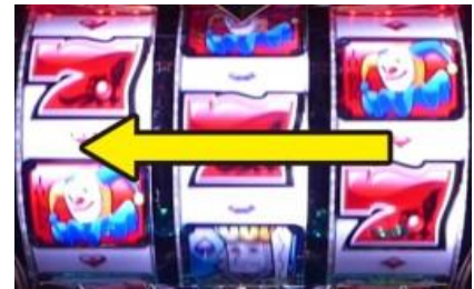
從右轉輪依序轉動