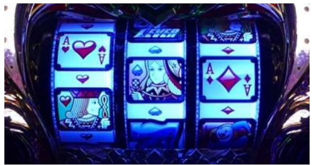
CHANCE TIME (RT)

RT 會在 BONUS 結束後突入，最大持續 30G 在這裡當選 BIG 可以聽到令人懷念的音樂