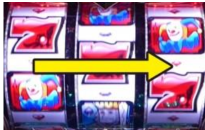
從左轉輪依序轉動