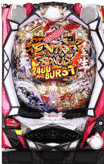
千珠平均該到達回轉數