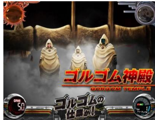
ゴルゴム神殿場景