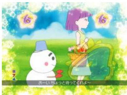
ココ助春夏秋冬之旅