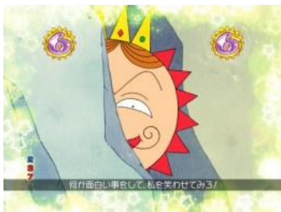
讓格蘭從洞穴裡出來