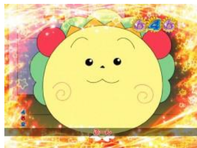
COJICOJI 就是 COJICOJI