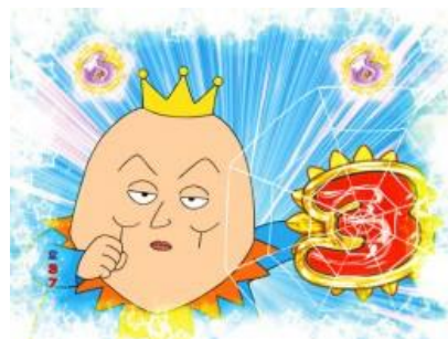
ドーデス城大危機