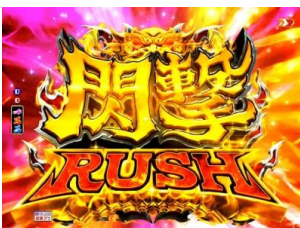
突入畫面(第 1~2 轉)