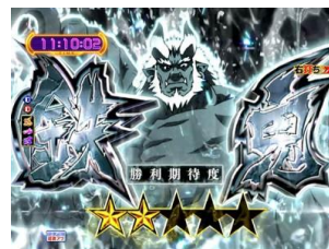
最終對決(第 10~13 轉)