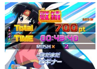
結算畫面(剩餘保留)

為時短 13 轉+剩餘保留 4 轉的模式，大當確率約 1/7.89，約 90%獲得大當+閃擊 RUSH 繼續 演出會依照轉數消化來變化，RUSH 中大多為立刻大當的演出，最後 4 轉會進行最終對決 結算畫面中剩餘保留也會抽選所以別太早放棄