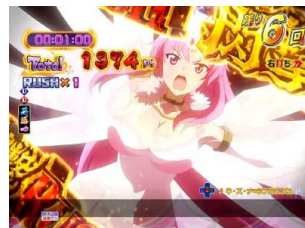
RUSH 中(第 3~9 轉)