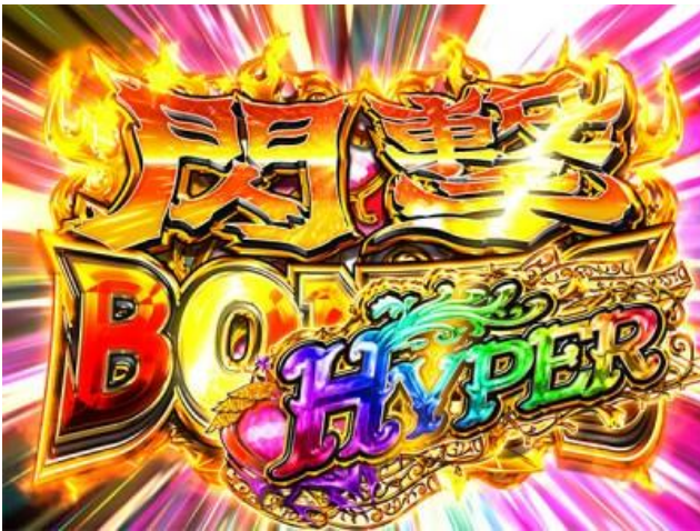
閃擊 BONUS HYPER