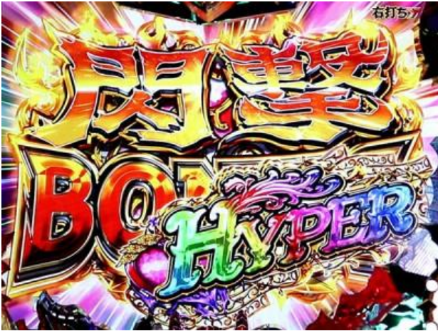
閃擊 BONUS HYPER