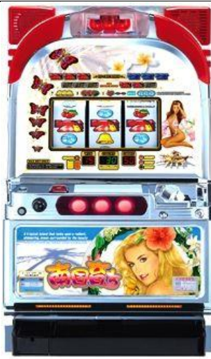
夏パネル(夏季面板)