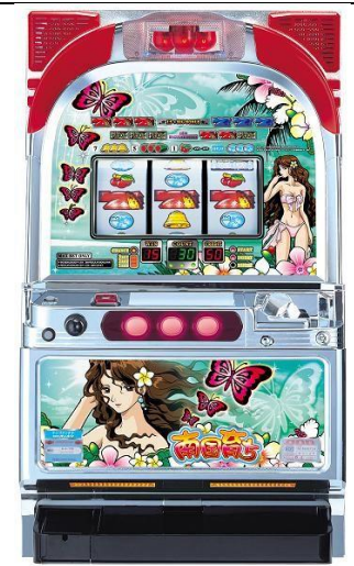
夏パネル(夏季面板)