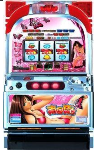
水着パネル(比基尼面板)