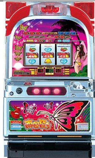
第 2 パネル(紅色蝴蝶面板)