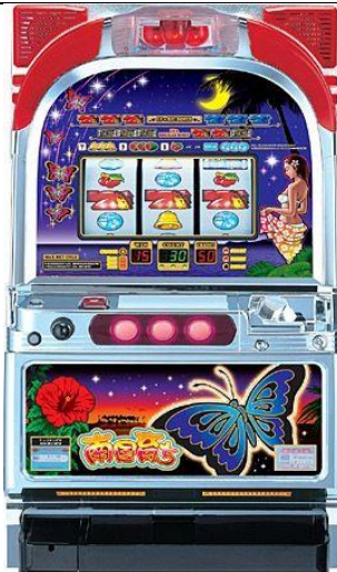
第 2 パネル(蝴蝶面板)