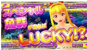
特殊魚群探索區間