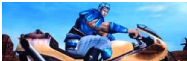
機車的顏色對應成立小役，機車的車身越大期待度越高