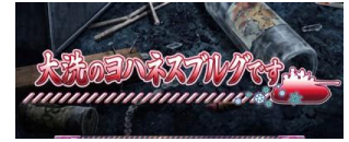
大洗的約翰尼斯堡