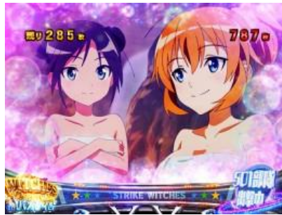
魔女祭典 in 洗澡時間