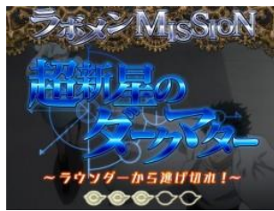
超新星的暗黑物質