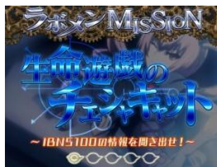
生命遊戲的柴郡貓