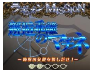
早上舞台劇的邂逅乖離