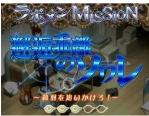
夜晚舞台劇的邂逅乖離