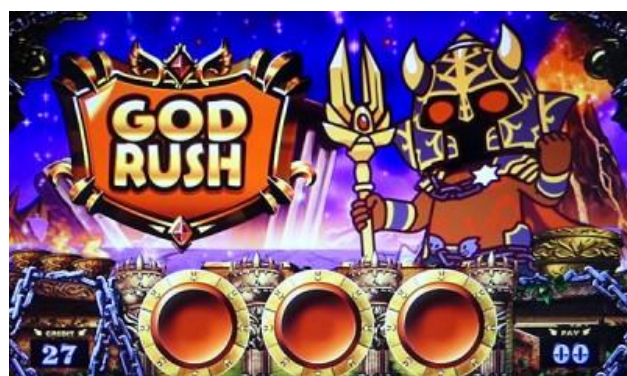
GOD RUSH 告知

挑戰成功期待度約 50%，瞄押冥王切入演出時形成冥王連線則突入 JUDGEMENT 切入演出種類期待度：藍色<紅色<真實角色