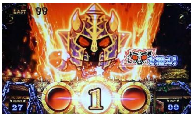
瞄押冥王切入演出