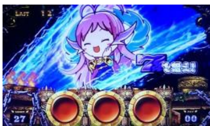
瞄押紫 7 切入演出