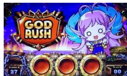
GOD RUSH 告知

挑戰成功期待度約 50%，瞄押紫 7 切入演出時形成紫 7 連線則突入 JUDGEMENT 切入演出種類期待度：藍色<紅色<真實角色。失敗時還是有機會發生發怒逆轉連線演出