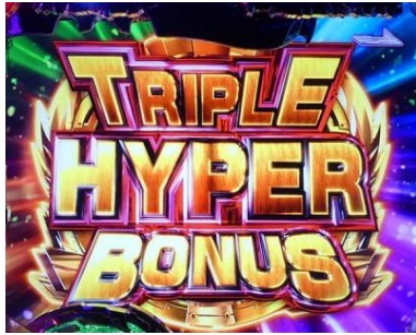
TRIPLE HYPER BONUS