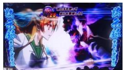
奴らの種類與數量

對決部分中消化一個奴ら珠為對決一戰，奴ら珠使用完前能將奴ら打倒的話則突入 AT 我方角色的期待度依序為：平野<孝<麗<毒島，之後選擇的武器要注意，越強的武器當然期待度越高 奴らの種類與數量也會有期待度不同，奴ら只有一隻時為好機，特殊的奴ら則為大好機