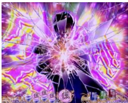
從哪裡都有可能發展的本機最強立直