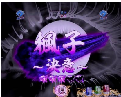
以楓子的主觀描繪的 SP 立直，能過突破內心的糾結嗎？