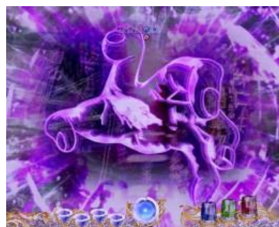
手的閃爍顏色變化時為好機