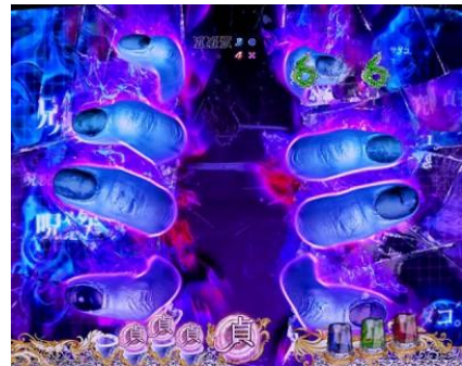
立直失敗後有機會發展的特殊 SP 立直