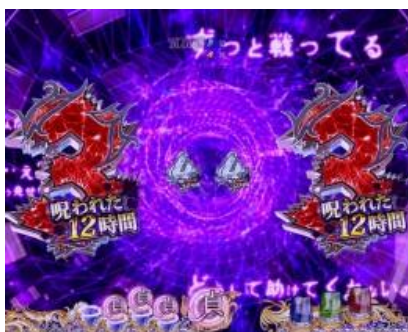
人們對話後前方有什麼潛伏著