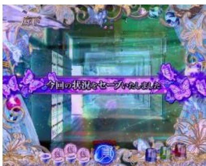
會持續發生相同的狀況