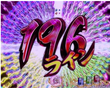
貞子的子分裂時增加立直線數的話為好機