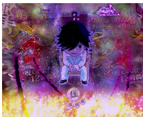
中間圖案出現柏田後中間圖案會變成 活動、警示燈、衝擊圖案!?