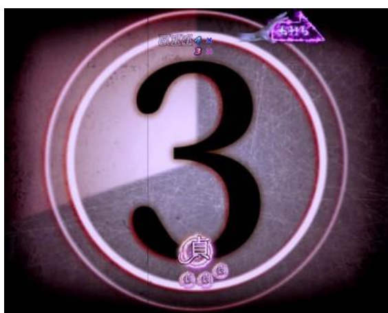
空白圖案停止後發生倒數 變成零時 ICON 會發生變化!?