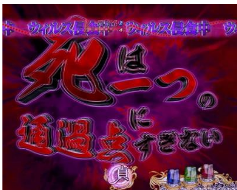
發生的話則為大好機