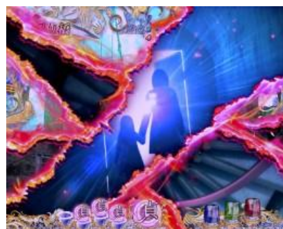
STEP UP 後貞子出現的話...