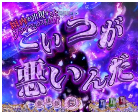
變動開始時突然發生，畫面被擊破的話則發展