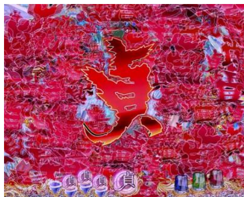
裸眼 3D 的文字群出現的大好機演出