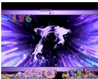
貞子接近時為好機