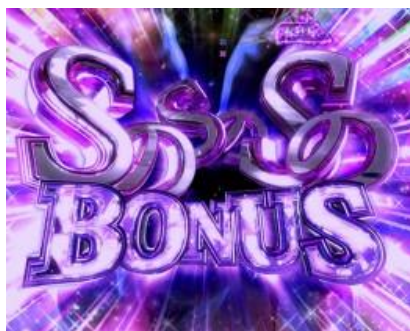
S 的 S 的 S 的 BONUS