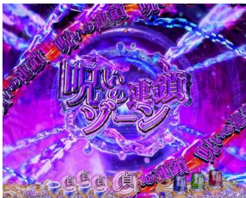
隨時有機會突入的區間演出