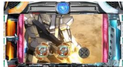
繼續判定(對決極限)

1SET 30G 以上繼續，純增 2.0~4.0 枚/G 的 AT。1SET 有三個部分所組成 首先決定對戰對手，主要的解析對戰對手在銅鐘連線時則上方的能量條會上升 銅鐘連續連線時則上升率會提升，7 連以上則為 MAX CHAIN!? 能量條獲得 20 點時則顏色會 上升，在對決極限中的挑戰次數也會增加：白色(六擇一次)、藍色(四擇以上一次)、 綠色(四擇以上兩次)、紅色(四擇以上三次)、金色(勝利確定)，對決極限中依照顏色發生 對應次數的猜押順挑戰，銅鐘連線或是特殊小役成立則繼續確定 然後會依照勝利時當下的顏色獲得狀態優裕或是當選 BB 等特典