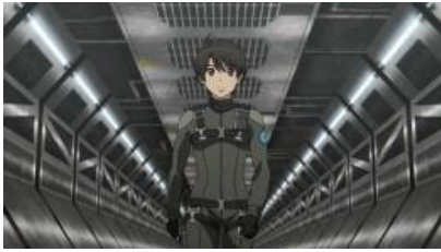
デューカリオン場景