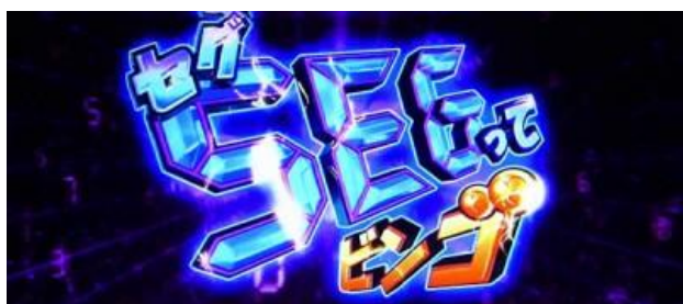
SEG DE BINGO