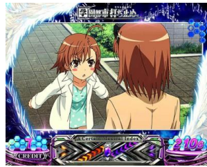
學園都市 最後之作