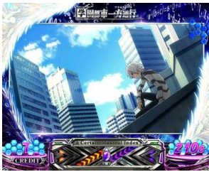
學園都市 一方通行