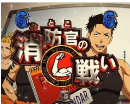
有三種演出期待度都很低 期待發展 SP 立直