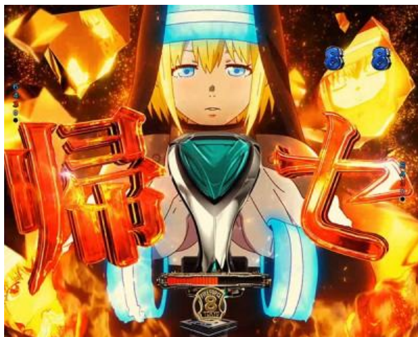
系列作經典的大好機演出，為四大演出之一 SP 立直的最後有機會發生