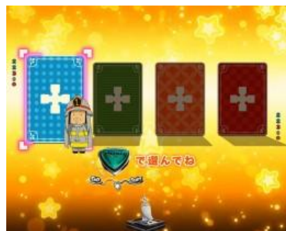
119 機會中使用按鍵選擇卡片 目標為選到大當