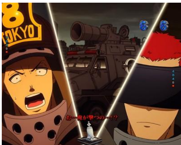
台詞、準心、警報器役物、角色閃爍出現紅色時 以及背景有力リム時為期待度上升的演出