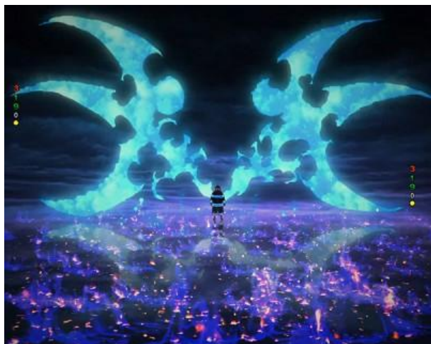
為四大演出之一，為立直後有機會發生的 大好機演出