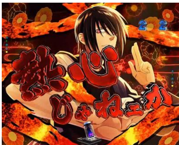
紅色標題、路徑分歧前背景有バーズ、煽動 發展時的書類較多、切入演出紅色，以上為機會 上升演出，演出路徑有紅丸與鬼牌路徑兩種