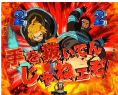
有四種演出期待度都不高 一樣期待發展 SP 立直