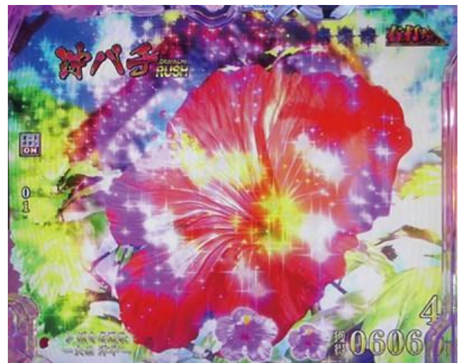
花綻放則獲得大當

沖繩鋼珠 RUSH 為花綻放則獲得大當的簡單明瞭模式，但也是有搭載前兆演出 蝴蝶的顏色(藍<紅<紫)與數量會示唆開花的期待度