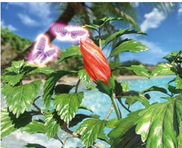
要注意蝴蝶數量與顏色