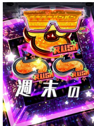
CHIKI CHIKI BAN BAN