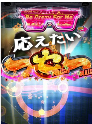
Be Crazy For Me