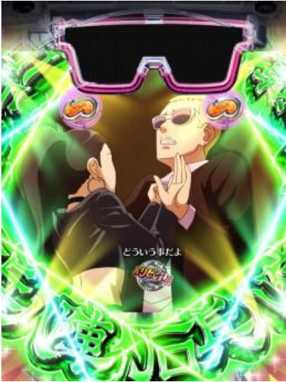
WARP 俱樂部 SP