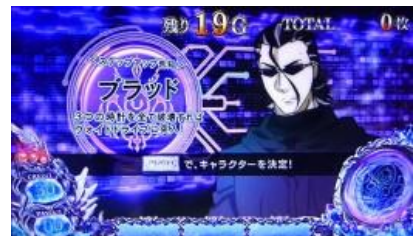
STEP UP 告知

TB 中有三種告知類型可以選擇，機會告知中演出成功則當選 VD 濃厚 完全告知則發生演出為 VD 濃厚，STEP UP 演出中到達 STEP 為 VD 濃厚