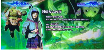
高設定期待度稍微上升