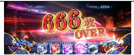
設定 6 濃厚