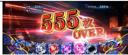
設定 5 以上濃厚