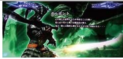
高設定期待度稍微上升