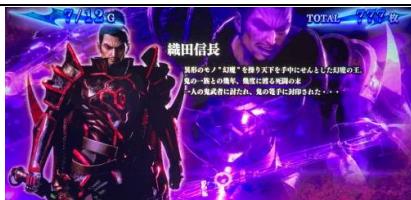
設定 4 以上濃厚