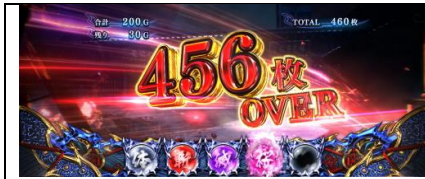
設定 4 以上濃厚