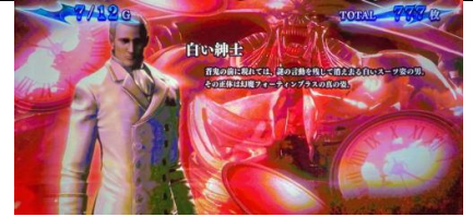
高設定期待度大幅上升