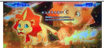
設定 6 濃厚