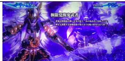
設定 5 以上濃厚