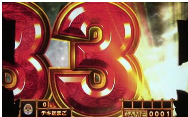
數字與起動同時巨大化的演出，前兆突入時比較容易發生，連續發生的話期待度上升