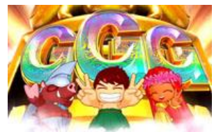
從轉輪凍結等當選的 ART 最少 7 SET!