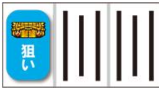
第一轉輪瞄壓大金色圖案 (以下稱為「千キ」)

千キ圖案整個停止時，中右轉輪皆瞄壓千キ，中右轉輪有任一千キ停止時為強千キ 皆無為弱千キ，無完整連線但三個轉輪都有千キ為最強千キ、完整連線時為神千キ