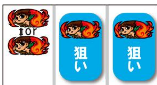
ムリポ圖案出現時，中右轉輪瞄壓ムリポ圖案