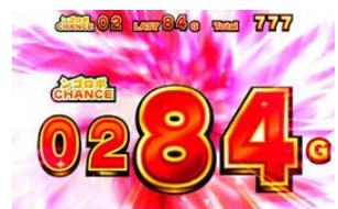
1 SET 100G，純增約 2.8 枚/G，繼續率 TABLE 管理型的 ART