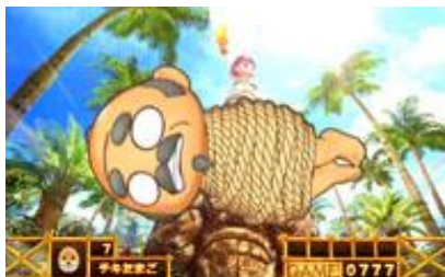
畫面上方落下爺的話為好機