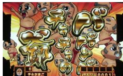
敲下起動桿時角色切入的話為好機，角色一共有四人，爺切入時為激熱演出