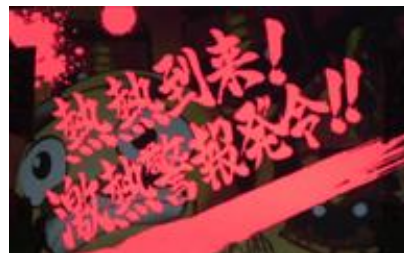
文字顏色的期待度為白<紅<金，文字內容有好機跟激熱等