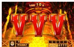
ART 2SET 以上確定