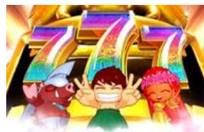
ART 最少也有 5 SET 為爆發契機的一個