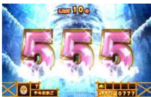
通常的 ART 當選 ART 會有 SET 數上乘