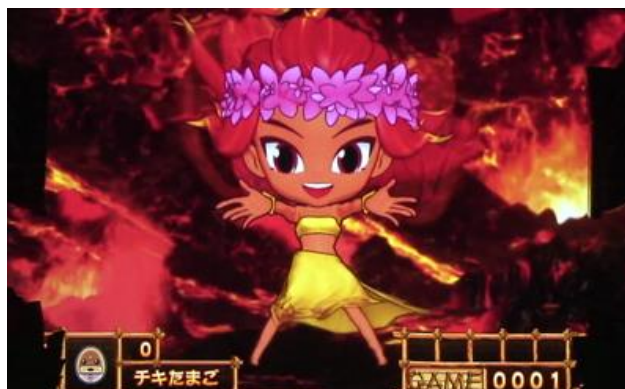
有三種不同的演出方式，發生時可期待特殊小役，上面右圖發生時為大好機