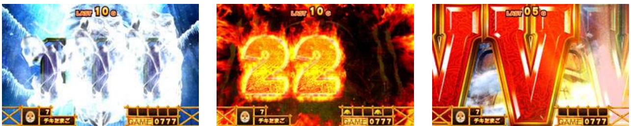
全部有三種，期待度依序為冰<炎<巨大化，通常時 G 數消化或是特殊小役成立後有可能會突入