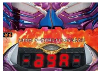
鬼 SEG 邪鬼王立直