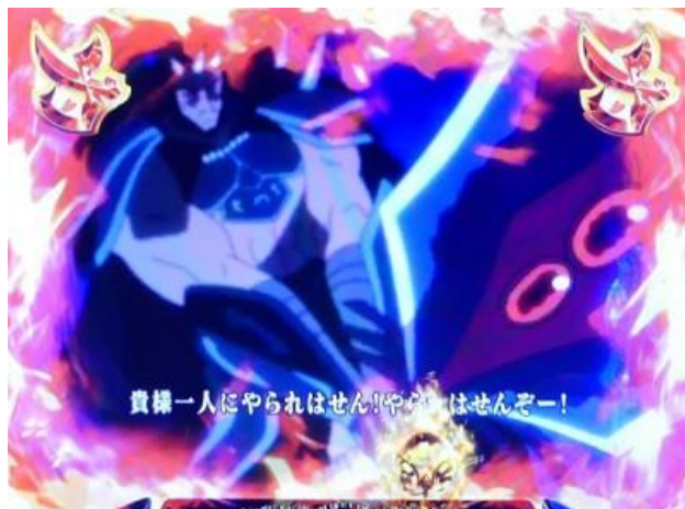
與邪鬼王的最終決戰，發展時為大好機！