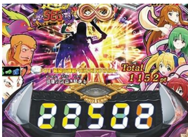
電嘴補助超過 100 轉時為超鬼 SEG 道 電嘴補助會一直持續到次回大當