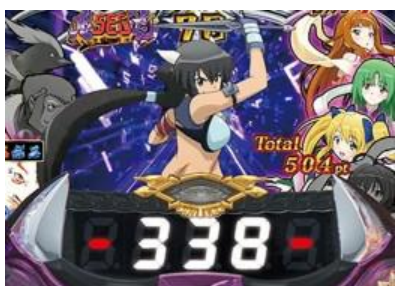
鬼 SEG 鬼姬立直