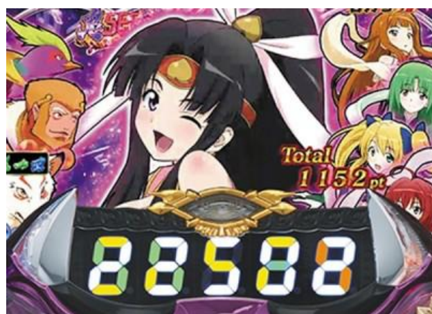
電嘴補助到達 100 轉後桃子登場的話 則會結束電嘴補助突入激鬼 7 RUSH