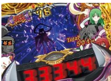
鬼 SEG 傾斜立直