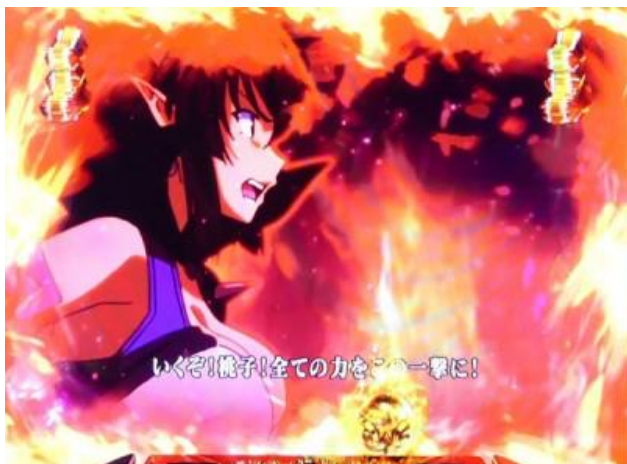
桃子與鬼姬對決，當然桃子勝利的話則獲得大當