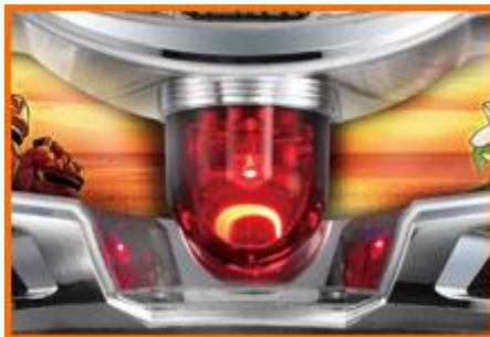
パトランプで告知