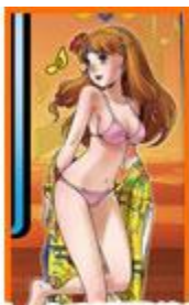
ボーナス終了後は 5G の「ときめきゾーン」に