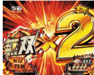
特圖 2 大當