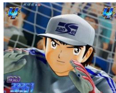
電嘴補助中 4R 大當