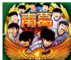
大家一起 PUSH ICON

往比賽之路的另外一個關鍵要素，演出有上面的幾種，獲得的圖案數量與種類會影響之後的演出出現的組合也會有影響。岬+翼為黃金組合、石崎+早苗+翼則為絆…等，特定組合完成時期期待度更高