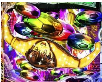
電嘴補助中 16R 大當