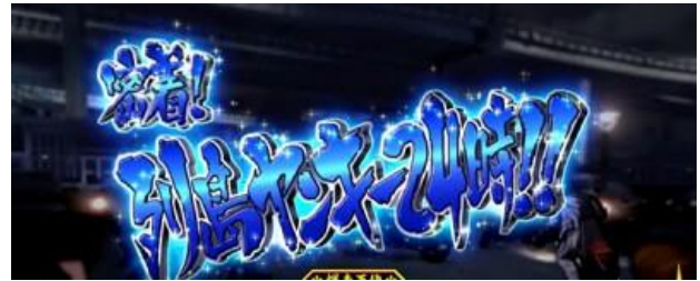
不良少年 24 小時