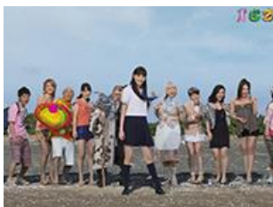
演員們講標題目標獲得大當的五大演出之一