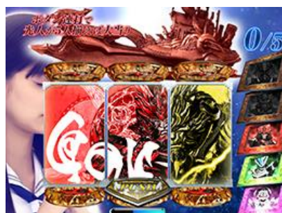
女性角色為主角的三種演出，期待度很低