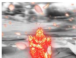
主角有著自信叫出名台詞，期待之後的演出