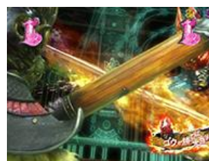
ゴウ勝利則獲得大當的演出，有機會從幾個預告演出後來發展此，從舍弟機會發展的期待度較高