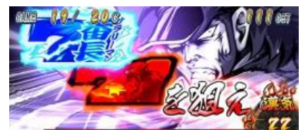
瞄押 7 切入演出

漢氣=繼續率上升時可期待繼續。巨大小役可獲得大量漢氣!? 第 20.25.30G 會發生三種漢氣對決 轟勝利則繼續濃厚，與小熊貓對決則為大好機，瞄押 7 切入演出發生時形成 7 連線則當選頂 RUSH 頂 RUSH 中的 BONUS，只要繼續的話則會獲得差枚數上乘