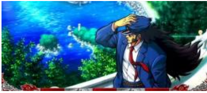
轟 or 鏡場景