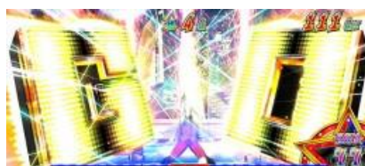
COME BACK CHALLENGE