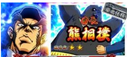
分公司/主公司演出