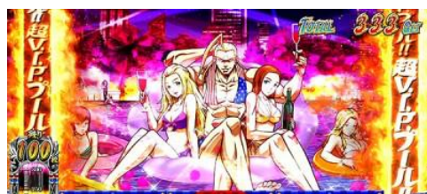
超 VIP 泳池