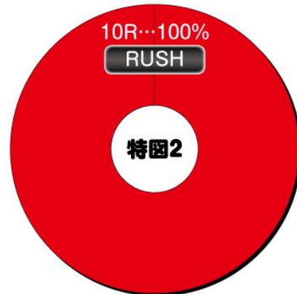
大當 ROUND 數分配比例-電嘴入賞時