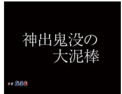
神出鬼沒的大盜賊