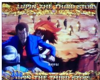
不二子在荒野永眠