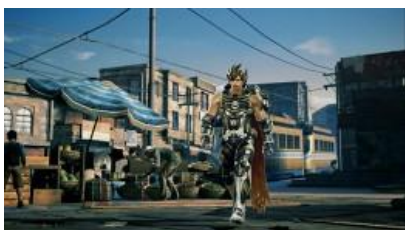
ユグドラシル場景