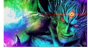
惡魔一八切入演出

一八先攻或是一八閃過對方攻擊時為繼續濃厚。金門或惡魔一八切入演出發生時為 AT 當選期待大 ROUND 開始畫面有好幾種，比較少出現的畫面則期待度較高